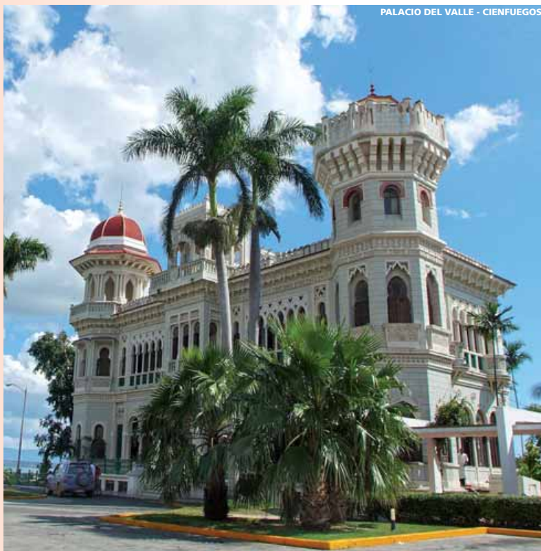
PALACIO DEL VALLE - CIENFUEGOS