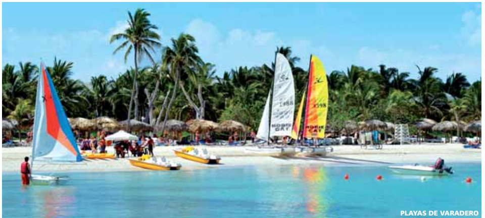
PLAYAS DE VARADERO

Incluyendo: 6 DESAYUNOS + 5 ALMUERZOS + 4 CENAS + 4 VISITAS y "Todo Incluido" EN VARADERO