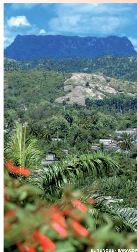
EL YUNQUE - BARACOA

Nota: Los hoteles en el interior de la isla son sencillos.