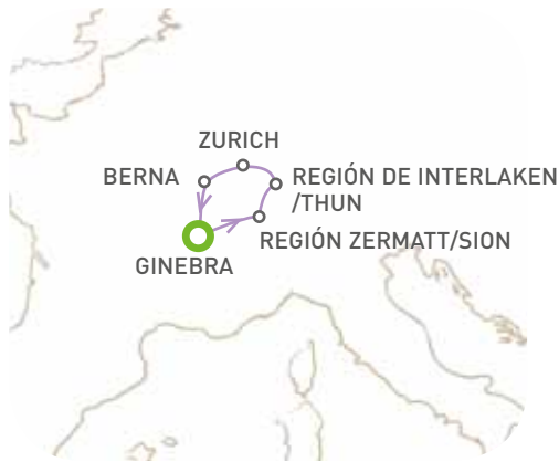
● Ciudades de inicio y fin de circuito.