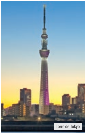
Torre de Tokyo

Desayuno. Por la mañana, visita de medio día de la ciudad en tour regular, incluyendo el Sepulcro de Meiji (en algunas salidas podrá ser sustituido por la Torre de Tokyo), la Plaza del Palacio Imperial y el Templo de Asakusa Kannon, con su arca comercial Nakamise. La visita finaliza en el Barrio de Ginza, el distrito comercial más famoso de Japón, con sus amplias avenidas y numerosas tiendas y cafés. Terminada la visita, podrán regresar al hotel individualmente o aprovechar la tarde libre para caminar por las calles de Tokyo. La ciudad de Tokyo fue fundada en 1.457, con el nombre de Edo, se convirtió en el cuartel general de Ieyasu, el primero del clan de shoguns, o señores guerreros. La ciudad fue rebautizada como Tokyo (que significa Capital Oriental) en 1.868. Alojamiento.