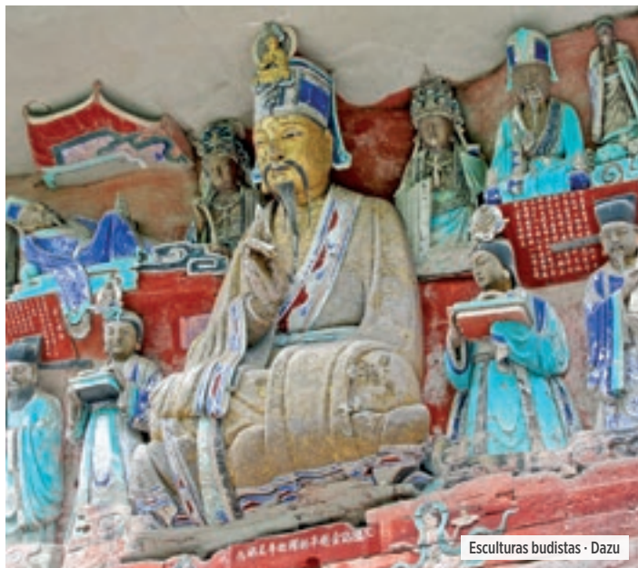
Esculturas budistas - Dazu

Desayuno. Por la mañana, realizaremos la visita al impresionante y renombrado Templo del Cielo, obra maestra construida en 1.420 con una superficie de 267hc. Este conjunto de edificios con el salón de la Oración por la Buena Cosecha, el Altar Circular y la Bóveda Imperial del Cielo, son Patrimonio de la Humanidad por la Unesco. Almuerzo. Por la tarde, salida en avión con destino Xian, ciudad de 3.000 años de antigüedad que fue capital de las 11 Dinastías y punto de partida de la "Ruta de la Seda". Llegada, traslado al hotel y Alojamiento.