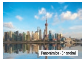
Panorámica - Shanghai

Desayuno. Traslado al aeropuerto para embarcar en el vuelo que le llevará de regreso a su punto de destino o conectar con otro de nuestros itinerarios. Fin de nuestros servicios.