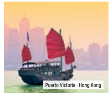
Puerto Victoria - Hong Kong

Desayuno. Traslado al aeropuerto para embarcar en el vuelo que le llevará de regreso a su punto de destino o conectar con otro de nuestros itinerarios. Fin de nuestros servicios.