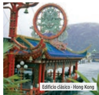
Edificio clásico - Hong Kong

Desayuno. Traslado al aeropuerto para embarcar en el vuelo que le llevará de regreso a su punto de destino o conectar con otro de nuestros itinerarios. Fin de nuestros servicios.