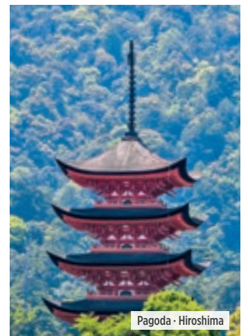
Pagoda · Hiroshima