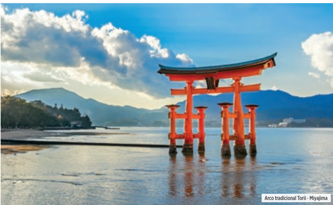
Arco tradicional Torii · Miyajima

Desayuno. Por la mañana, visita de medio día de la ciudad en tour regular, incluyendo el Sepulcro de Meiji (en algunas salidas podrá ser sustituido por la Torre de Tokyo), la Plaza del Palacio Imperial y el Templo de Asakusa Kannon, con su arcada comercial Nakamise. La visita finaliza en el Barrio de Ginza, el distrito comercial más famoso de Japón, con sus amplias avenidas y numerosas tiendas y cafés. Terminada la visita, podrán regresar al hotel individualmente o aprovechar la tarde libre para caminar por las calles de Tokyo. La ciudad de To-