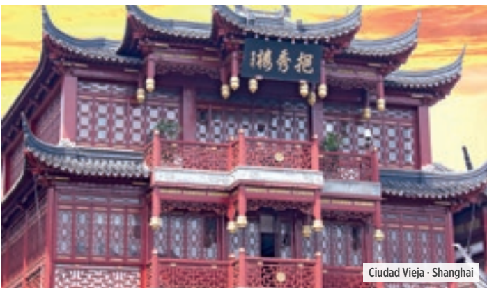
Ciudad Vieja · Shanghai

Desayuno. Traslado al aeropuerto para embarcar en el vuelo que le llevará de regreso a su punto de destino o conectar con otro de nuestros itinerarios. Fin de nuestros servicios.