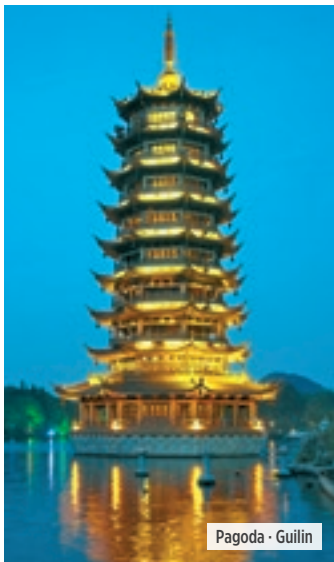
Pagoda - Guilin

Desayuno. Beijing cuenta con una historia de más 3.000 años y es rica en lugares y vestigios históricos y culturales. Visita de la ciudad: el Palacio Imperial, más conocido como la "Ciudad Prohibida" es un complejo con más de 980 edificios de arquitectura tradicional china, declarado Patrimonio de la Humanidad por la Unesco, y la Plaza de Tian An Men, una de las mayores del mundo. Almuerzo y visita del Palacio de Verano y su extenso parque, utilizado de manera exclusiva en tiempos de la Dinastía Qing por los miembros de la Casa Imperial, donde entre sus construcciones destaca el Barco de Mármol. Por la noche, asistencia a una representación de acrobacia. Alojamiento.